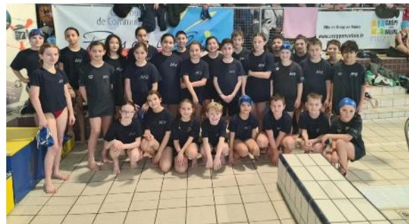
Les licenciés avenir de JEUNESSE ET NATATION COMPIEGNE ont disputé la première étape du trophée départemental à Crépy-en-Valois. Ils y ont remporté de nombreuses médailles et le relais final.