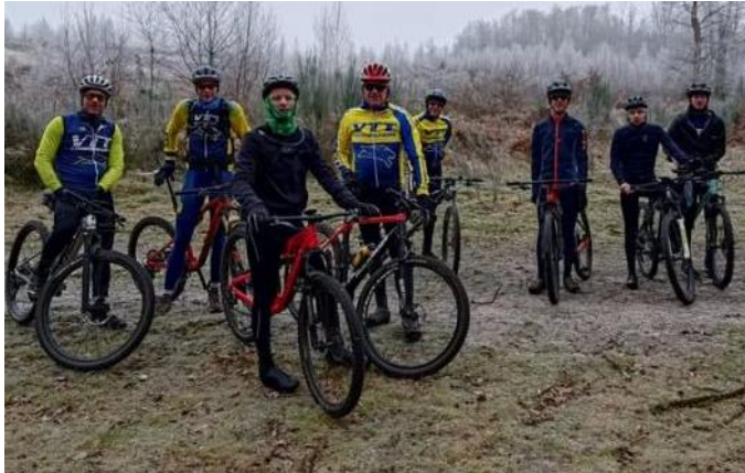
Malgré des conditions climatiques délicates, les membres du VTT COMPIEGNOIS multiplient les sorties.