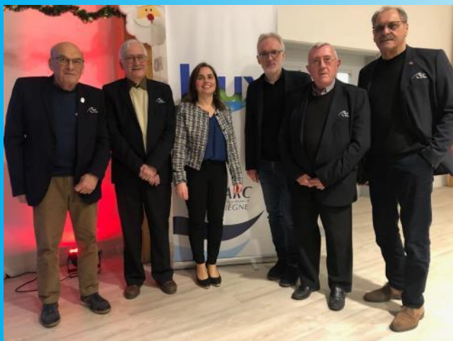
Mardi 14 janvier à Jaux