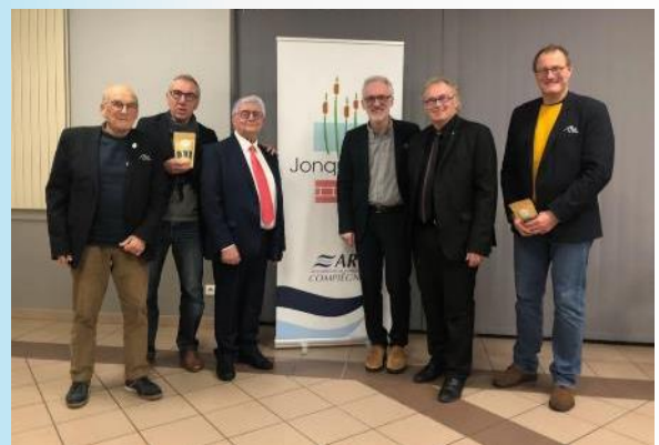
Mercredi 15 janvier à Jonquières