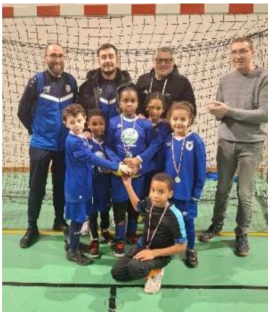
L'US VERBERIE a organisé son traditionnel tournoi de futsal pour les jeunes licenciés du club.