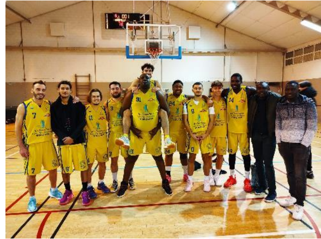
Avec dix succès en onze matches, l'équipe masculine du BB LA CROIX est en tête de son groupe à mi-saison à égalité avec Belleu (Aisne).