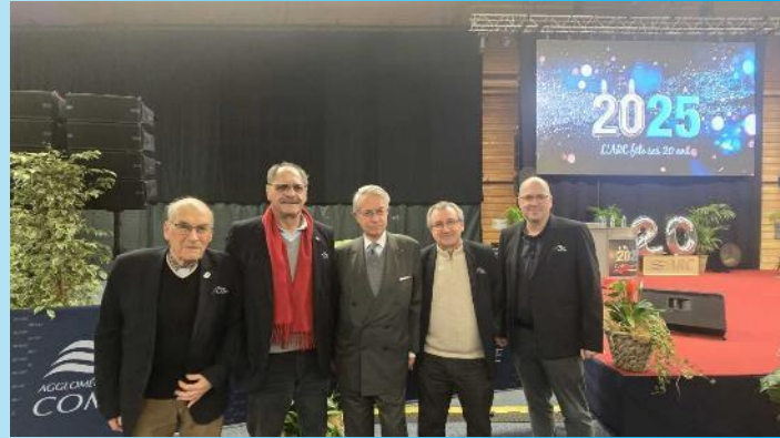
Vendredi 17 janvier, vœux de l'ARC à Venette