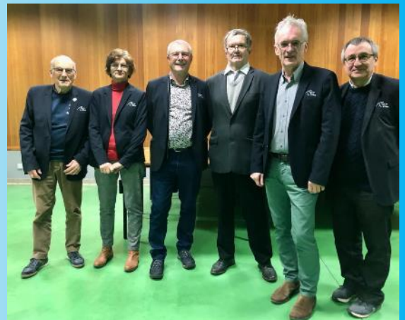
Lundi 20 janvier à Bienville