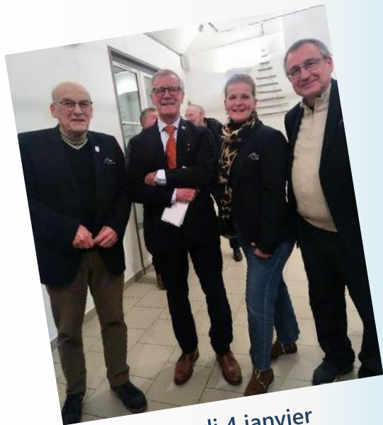
Samedi 4 janvier à Saint-Jean-aux-Bois