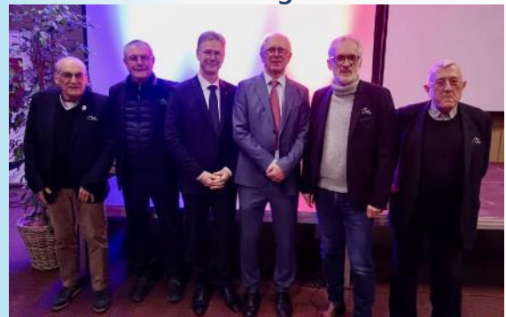
Lundi 13 janvier à Choisy-au-Bac