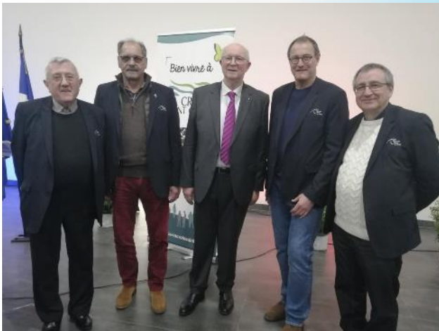
Mardi 21 janvier à La Croix Saint-Ouen