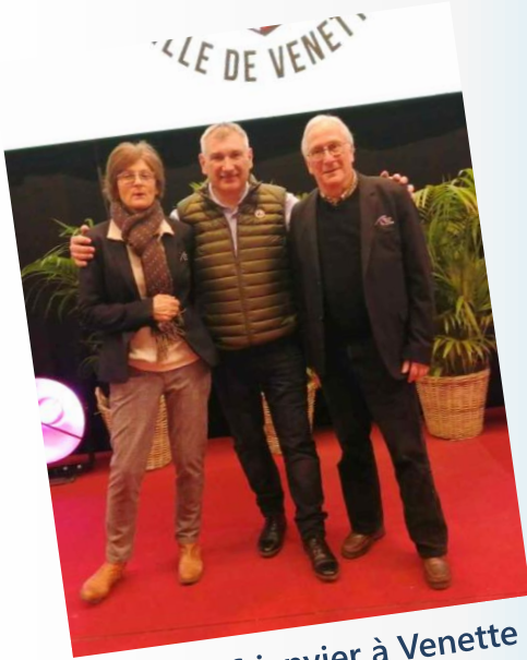
Jeudi 16 janvier à Venette