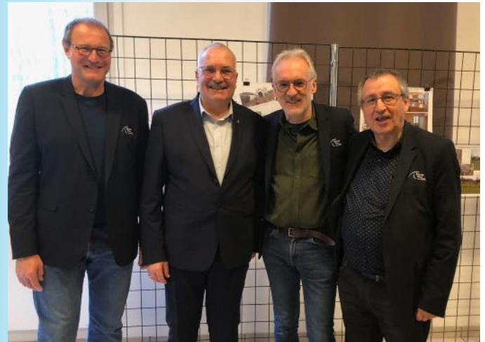
Samedi 11 janvier à Saint-Vaast-de-Longmont