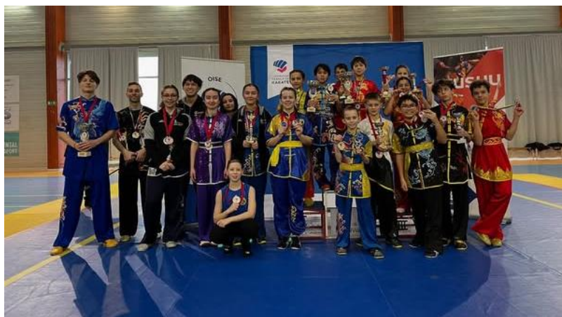
A Beauvais, lors de la première compétition de l'année, les licenciés du CAMCO (Centre des arts martiaux chinois de l'Oise) ont brillé.

Pour en savoir plus, contactez Sylvie ou Walter au bureau de l'OSARC (06 52 94 92 82).