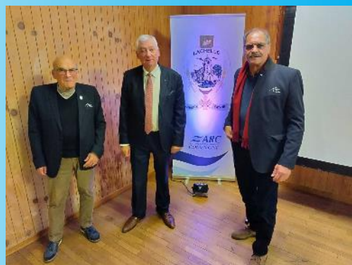
Vendredi 10 janvier à Lachelle