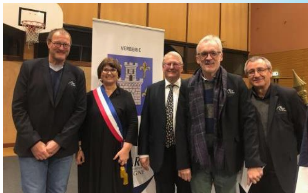
Jeudi 9 janvier à Verberie