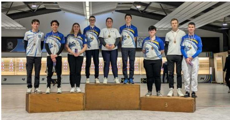
LES ARCHERS DE COMPIEGNE ont brillé à domicile lors des championnats départementaux jeunes, avec au total quinze médailles.