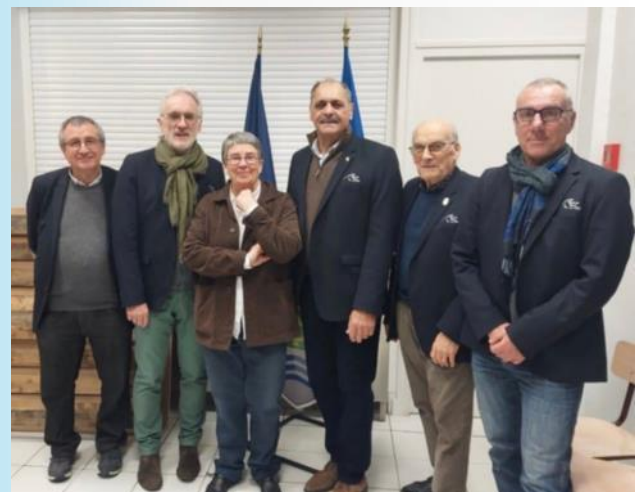
Vendredi 31 janvier à Vieux-Moulin