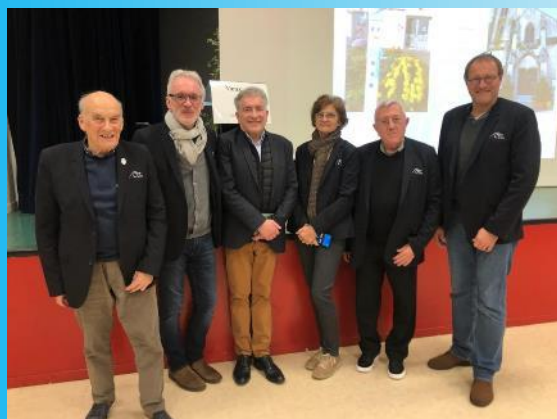
Mercredi 29 janvier à Saint-Sauveur