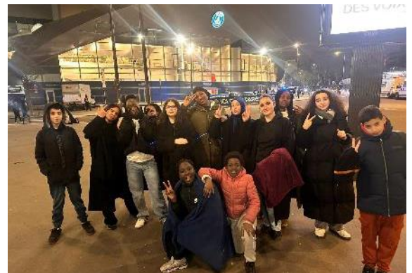
Les féminines de la JSA COMPIEGNE ont assisté au match de D1 opposant les joueuses du Paris SG à leurs homologues de Lyon, au Parc des Princes.