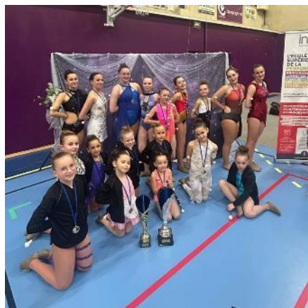
Les jeunes du TWIRLING CLUB MARGNOTIN ont brillé à Chalons-en-Champagne avec un succès au challenge benjamin N2.