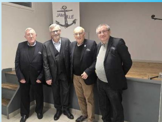
Mercredi 8 janvier à Janville