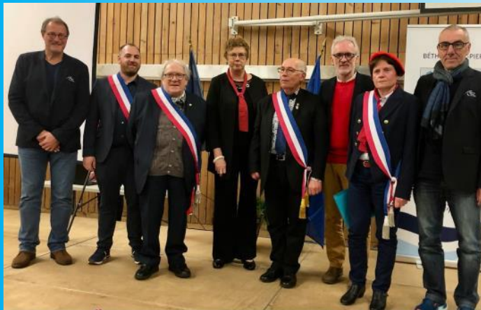
Lundi 27 janvier à Béthisy-Saint-Pierre