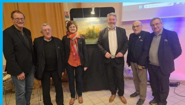
Jeudi 23 janvier à Armancourt