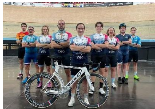
C'est désormais une habitude, les licenciés de COMPIEGNE TRIATHLON organisent des déplacements à Roubaix pour pratiquer le cyclisme sur piste l'hiver.