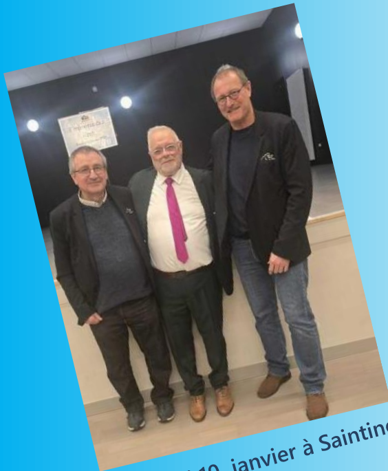
Vendredi 10 janvier à Saintines