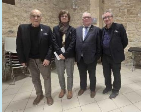
Mercredi 22 janvier à Néry