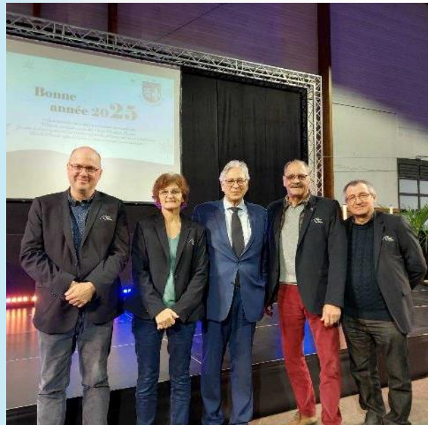
Vendredi 24 janvier à Margny-lès-Compiègne