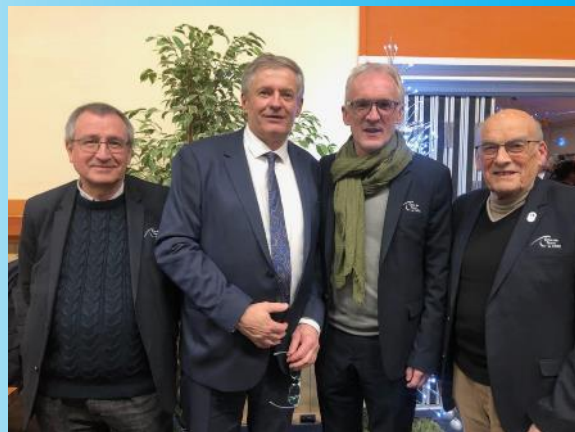
Mardi 7 janvier à Clairoux